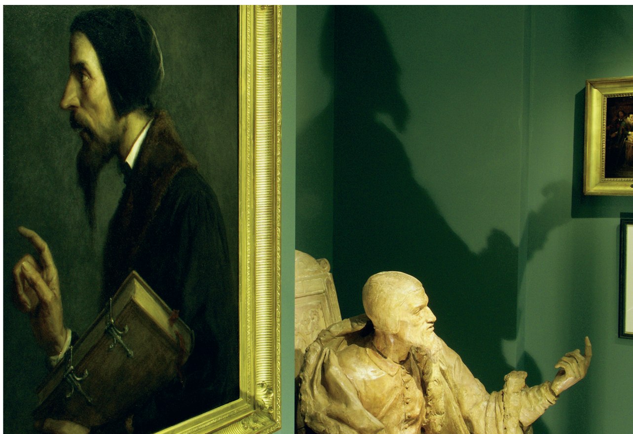
Deux représentations de Calvin au XIX e siècle: une huile d'Albert Anker et un plâtre du sculpteur genevois Maurice Reymond

Pour l'heure, il m'importe de poursuivre la marche du Musée: nous bénéficions pour cela d'une