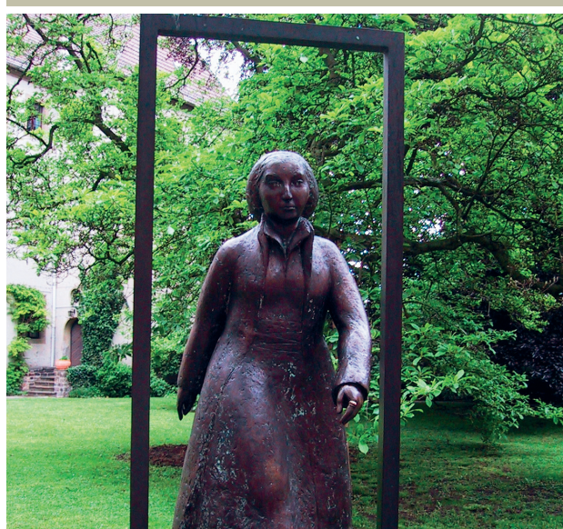
Katharina von Bora au Lutherhaus à Wittenberg