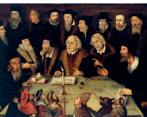
Luther dans le cercle des Réformateurs. Anonyme. Huile sur bois. Vers 1625 - 1650. Berlin, Deutsches Historisches Museum.