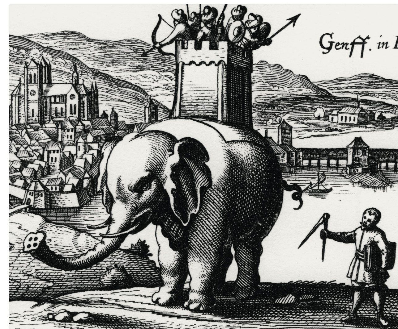
Une forteresse hérétique. Gravure de Thesaurus philo-politicus de David Meisner (1624). L'éléphant symbolise Genève, citadelle du protestantisme, et les Turcs qui le montent sont ses habitants hérétiques. A voir dans la salle de la Polémique.

Ce sera l'un des objectifs de notre série de conférences autour de la question de l'image et du religieux, donnant la parole à des spécialistes qui sauront éclairer notre jugement.