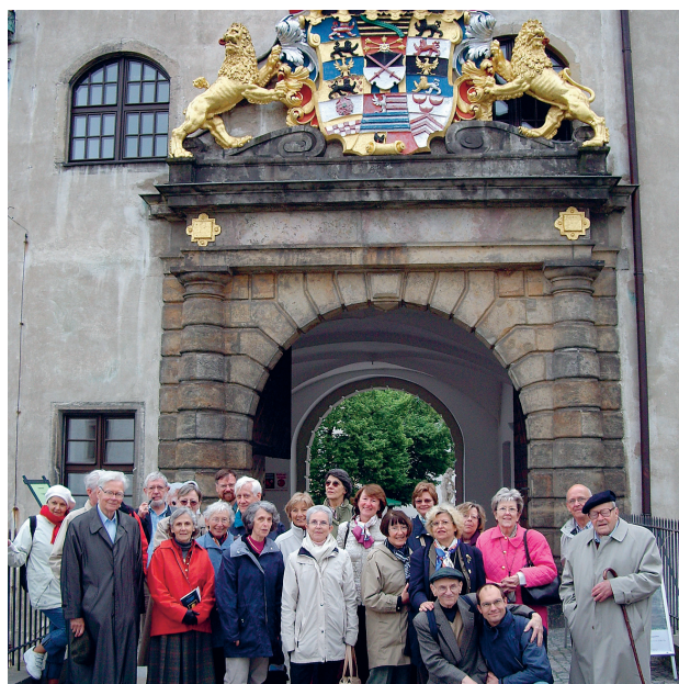
Les participants du voyage à l'entrée de Torgau