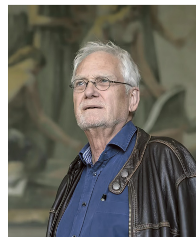
Philippe Borgeaud, historien des religions, en 2016.